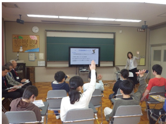
行政相談クイズに答える児童たち

「行政相談クイズ」も行われ、最後に行った行政相談についてのアンケートでは、絵を使って説明して貰って良く判った、これから何か困ったことがあったらボランティアの行政相談委員に相談する等々と非常に多くの感想が寄せられました。