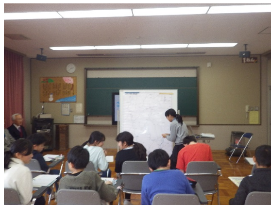
熱心にアンケートに記入する児童たち

また、児童が日ごろ感じている地域での問題点も出されましたので、解決に向けて関係機関と対応を行って結果を児童に返していくようにしております。