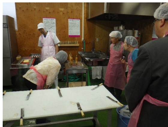
かまぼこ・平天・ちくわ作りの様子