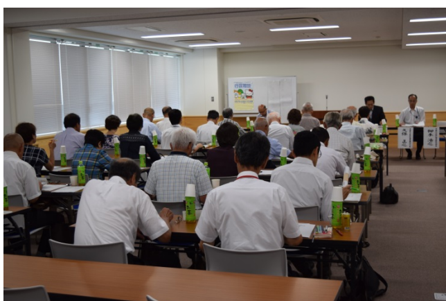
会場の様子 (京都市・南丹地区)