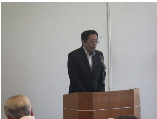
挨拶をする花田所長（中丹・丹後地区）

行政相談活動は、一年を通じて実施していますが、行政相談週間前後の府下各地で開催されます合同行政相談所や特設相談所は特別です。平成 28 年度は「届けよう 地域の問題 行政に」をスローガンに様々な機会での広報活動の展開や相談所の開催を行います。