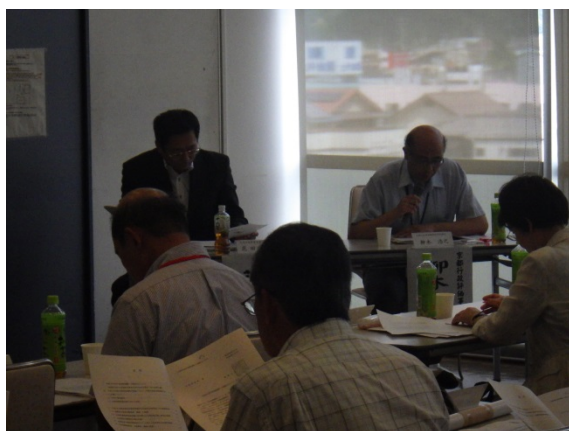
説明をする柳木課長 右側（中丹・丹後地区）