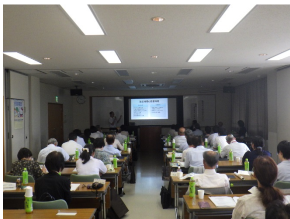
会場の様子 (洛南・山城南地区)